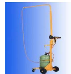
Chariot porte bouteille 13kg avec potence