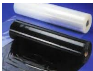
Le film bâtiment épais